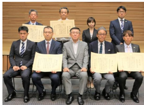
県知事と受賞企業(上段一番左)